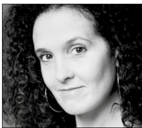
Kirstine Hedrup Skuespiller