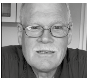
Jørgen Niss Værksted