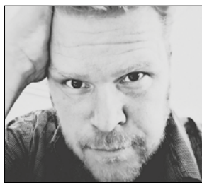
Sune C. Abel Skuespiller