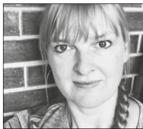
Ise Klysnér Kjems Lysdesign